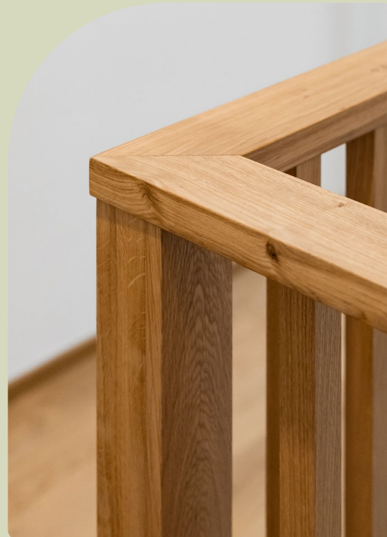
↗ Schodiště, zábradlí a osvětlení