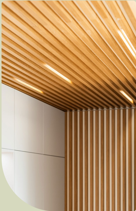
↖ Skryté dveře, lamely a osvětlení